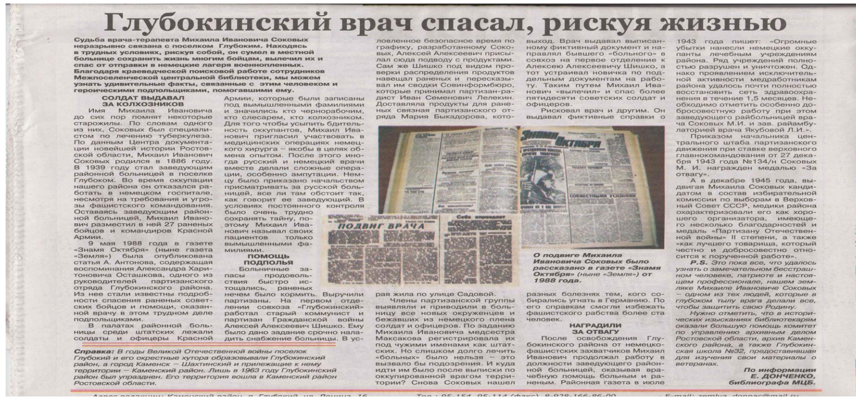
Справка: В годы Великой Отечественной войны поселок Глубокий и его окрестные хутора образовывали Глубокинский район, а город Каменск – Шахтинский и прилежащие к нему территории – Каменский район. Лишь в 1963 году Глубокинский район был упразднен. Его территория вошла в Каменский район Ростовской области.